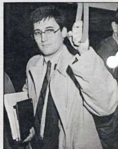
Rankl warnt vor Anlaufproblemen.

Schwerzler: In Ballungsräumen könnte so etwas Wirklichkeit werden. Weil es Automaten aber noch nicht gibt, war es wichtig, günstige Langzeitkarten anzubieten. Wir haben in den Verhandlungen auch erreicht, daß man jetzt mit einer gültigen Karte hinten einsteigen darf.