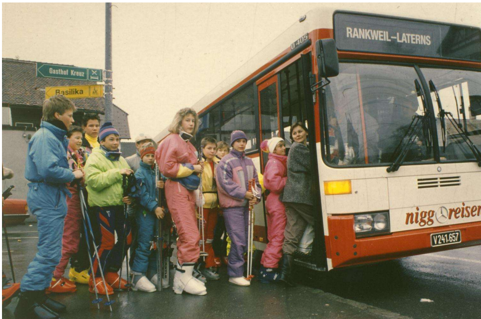
Der Skibus in Rankweil.

„Die Einrichtung des Vorarlberger Verkehrsverbund ist eine tolle Sache. Die Information der Medien ist so gut, daß sich vorerst keine Fragen ergeben.“ 10 „Den VVV finde ich ganz toll, endlich einmal etwas für Nicht-Autofahrer. Auch für Familien ist das Angebot ganz prima. Einige Fragen hätte ich aber doch.“ 11 So einige Leserbriefe in der NEUEN Vorarlberger Tageszeitung als Reaktionen auf die Gründung. Die Vorarlberger Bevölkerung zeigte sich durchwegs zufrieden. Insbesondere die günstigen und leicht verständlichen Tarife, der einfache Zugang zu Bus und Bahn (nur mehr eine Fahrkarte) sowie die Spezialangebote kamen gut an. So erhielten zum Beispiel Skifahrer:innen, die mit Öffis ins Skigebiet angereist kamen, eine 20-prozentige Ermäßigung bei den Skiliften.