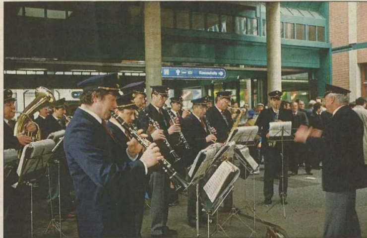
Die Eisenbahnmusik Feldkirch spielte zum „Geburtstag“ des Verkehrsverbundes am Bregener Bahnhof auf.

Verkehrsreferent LStH. Dr. Herbert Sausgruber dankte ge-